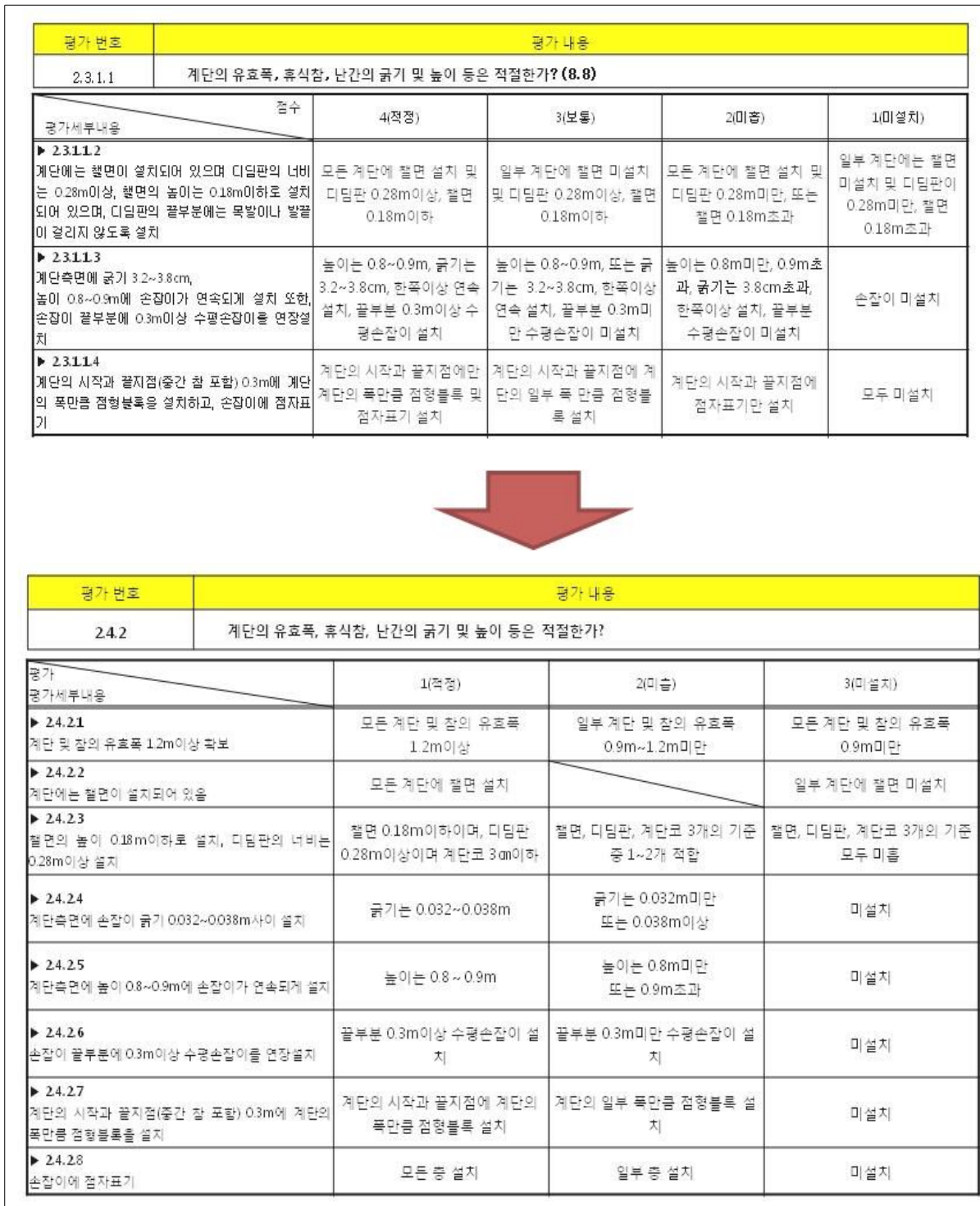
(그림 4) 세부항목 비교표 (2008년 대비 2013년)

장애인편의시설의 세부조사항목은 각 세부편의시설 항목마다 ‘대상시설별 편의시설의 종류 및 설치기준’ (편의증진법 시행령 제4조 관련 별표2)에 의거하여 작성하였으며, 2008년 전수조사 89개의 세부항목보다 2배 가까이 많아진 160개 세부항목으로 증가하였다. 또한 2013년 장애인편의시설 전수조사표의 세부조사항목들은 <표 1-3-3>과 같다.